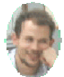
From D. R. (井荻校/Saitoh)

For example, when going to your company, despite what time it is, morning or not, we should say "Ohayo". I felt Japanese was difficult but interesting.